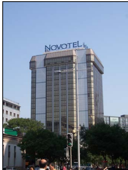
Hotel Novotel Peace en Pekín, instalación para Casa América y Casa México durante los Juegos Olímpicos del 2008.