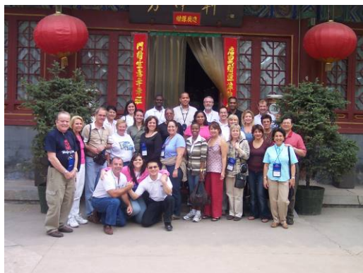
Personal de Cartan Tours y GSP con varios Subagentes, durante el viaje de familiarización "FAM TRIP" a Pekín, China.