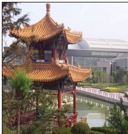
Pintorescos jardines del complejo hotelero “Internacional Leisure City”. Una de las sedes de Cartan Tours durante el verano de 2008, con su reconocido mundialmente Centro Acuático y su famosa Pagoda.