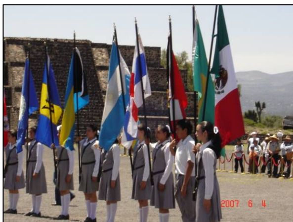
(Arriba) La tradición y el espectáculo de la ceremonia de la encendida de la antorcha de los Juegos Panamericanos, Río 2007, celebrada en las pirámides de Teotihuacan, México, el 4 de junio de 2007. (Foto derecha) El folleto doméstico de Cartan Tours, disponible en la página www.ccartan.com