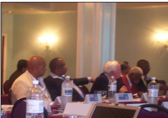
Oficiales de CON's del Caribe durante la reciente Asamblea General de CANOC realizada en Nassau, Bahamas en Noviembre de 2006, muy concentrados escuchando las presentaciones por parte de Río 2007 y Guadalajara 2011.